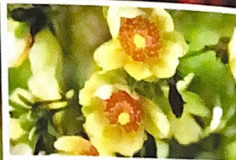
Mulungu, uvaia e ora-pro-nobis. Exemplos da riqueza da biodiversidade brasileira