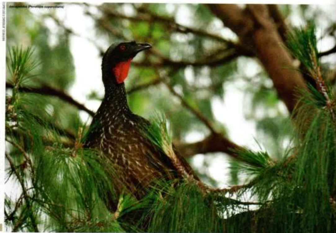
Perdix superciliosa (Perdix superciliosa)

ta, além de ter para onde se deslocar, fora do caminho das máquinas.