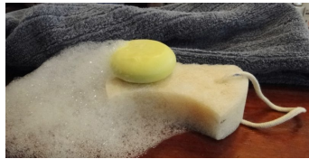
A esponjinha feita com fibras da folha da bromélia

Fácil de secar e com um cordão de algodão para pendurar na torneira do chuveiro, a esponjinha ainda é fabricada sem uso de solventes orgânicos voláteis. A fibra do curauá é misturada com um pouco de fibra sintética de garrafa PET. E a reciclagem de PET, como sabemos, tira esse plástico persistente do meio ambiente, que de outra forma levaria uns 450 anos para se decompor. A reciclagem costura também para a geração de renda dos catadores urbanos.