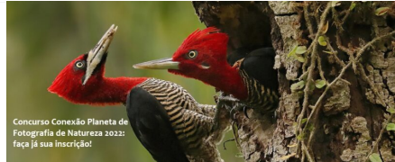
Concurso Conexão Planeta de Fotografia de Natureza 2022: faça já sua inscrição!