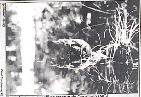
"Jacaré-do-pantanal" na reserva de Caratinga (MG)