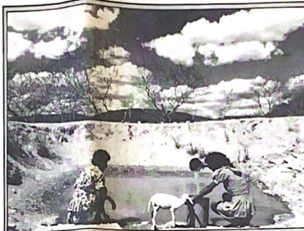
A aridez na região rural de Arcoverde (PE)

Quarta-feira, 5: 10h, inauguração da nova sede e laboratório da Cetesb em Cubatão; 11h, também em Cubatão, lançamento do programa da Comgás "Gás Natural em Cubatão". Às 14h, na secretaria de Energia e Saneamento, assinatura de protocolo entre a Comgás e a Shell do Brasil para fornecimento de gás natural para veículos. Às 15h, no Palácio dos Bandeirantes, ato solene dividido em cinco partes: a) - Liberação de recursos para desapropriação de área da Estação Ecológica de Juréia-Itatins; implementação de um plano emergencial para aquela unidade de conservação e instalação da Estação de Itinguçu; b) - Assinatura de convênios entre quatro secretarias para programas de educação ambiental e turismo ecológico; c) - Criação de grupo de trabalho da Procuradoria Geral do Estado e da secretaria de Justiça e Defesa da Cidadania para regularização fundiária dos 82 parques e reservas do Estado; d) - Criação do Projeto SP-Eco-92, que coordenará a participação da ONU no Rio de Janeiro; e) - Lançamento da Operação Mata-Fogo, para prevenir incêndios até 31 de outubro nas florestas nativas e plantadas, sob coordenação da Coordenadoria Estadual de Defesa Civil.