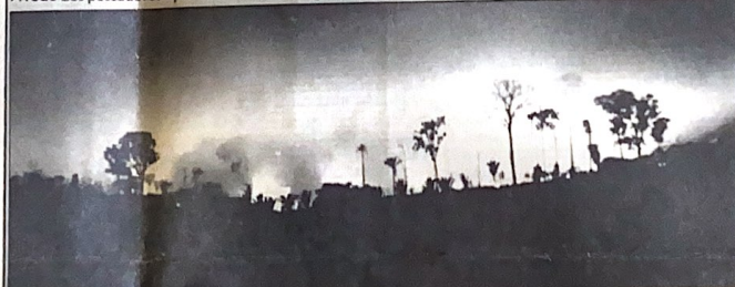
A floresta amazônica arde durante a noite; queimada em Arquelemes, Rondônia